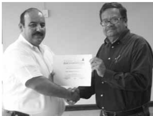
pasa a la página 2