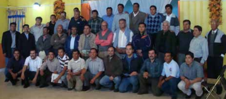
pasa a la página 6

Se habló que en la Iglesia debemos esforzarnos por mantener la unidad del Es-