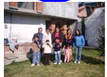
información en la página 6

Dios movió, uso y dispuso de lo que se constituye una sola Iglesia